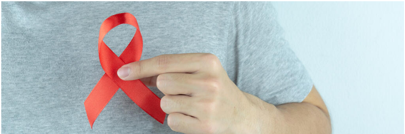
Schüler mit Aidsschleife

Die Bekämpfung des HI-Virus und die Eindämmung von AIDS sind nach wie vor drängende weltweite Probleme . Auch in Deutschland steigt die Rate der HIV-Erstinfektionen trotz eines hohen Wissensstandes in der Bevölkerung wieder an. Die AIDS-Prävention an den Schulen dient der gesundheitlichen Aufklärung und hilft, soziale Ausgrenzung von AIDS-Infizierten zu verhindern.