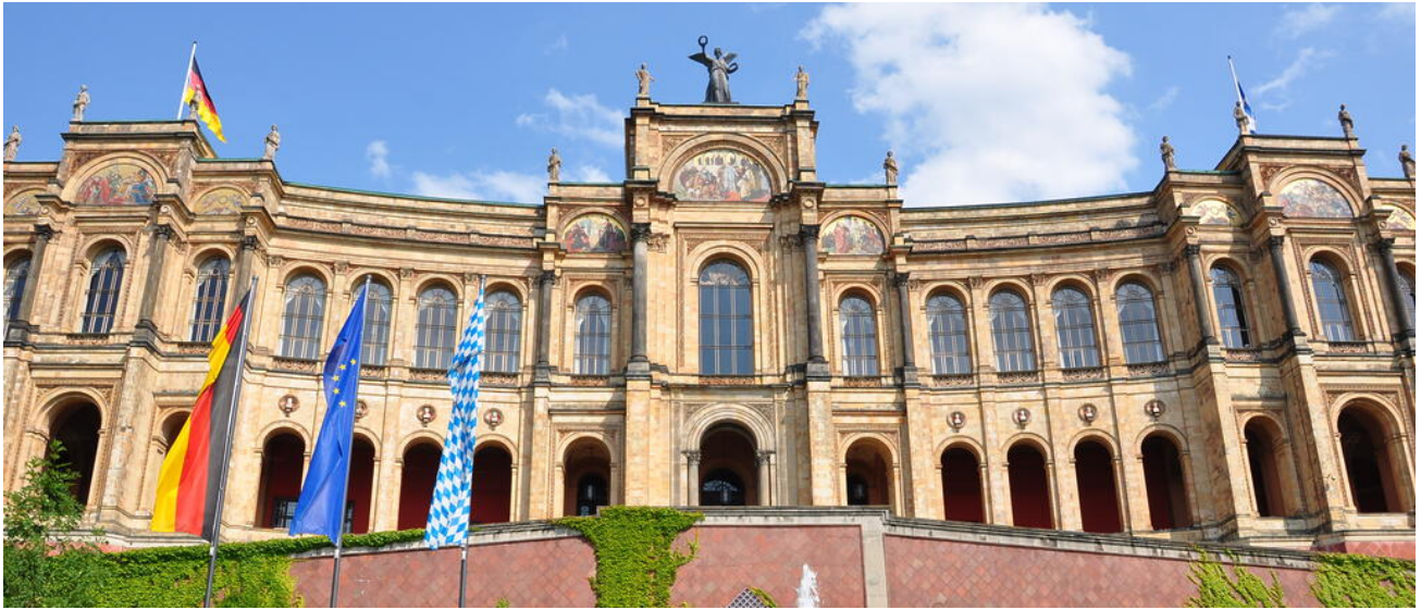
Das Maximilianeum: Der Sitz des Bayerischen Landtags

Demokratie ist eine gesamtgesellschaftliche Aufgabe: Unsere Demokratie setzt auf Menschen, die verantwortungsvoll und engagiert, reflektiert und urteilsfähig sind. Sie braucht mündige Bürgerinnen und Bürger, die sich stark machen für unsere Sicherheit, unsere Freiheit und unser friedliches Zusammenleben.