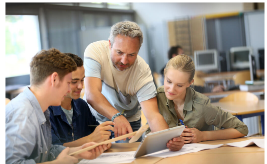
Die Begleitung und Beratung der Schülerinnen und Schüler gehört ebenso wie die Unterstützung zu den Kernaufgaben der Lehrkräfte am Gymnasium

https://www.km.bayern.de/lernen/schularten/weitere-schularten/internate mit angegliedertem Gymnasium dar.