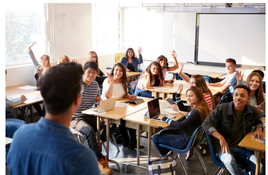
Das breite Fächerspektrum am Gymnasien kommt den individuellen Interessen und Neigungen der Schülerinnen und Schüler entgegen

Je nach Interesse und Begabung kann aus verschiedenen Fremdsprachen und Ausbildungsrichtungen gewählt werden. Individuelle Förderung ist integraler Bestandteil gymnasialer Pädagogik.