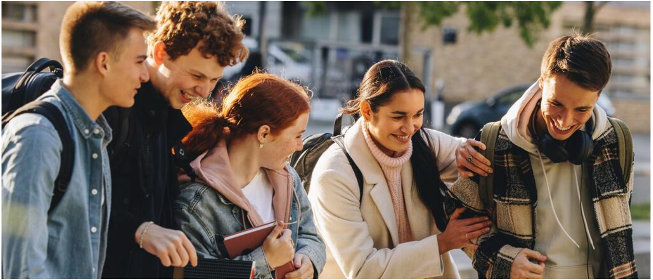
Das bayerische Gymnasium ist der direkte Weg zur Allgemeinen Hochschulreife