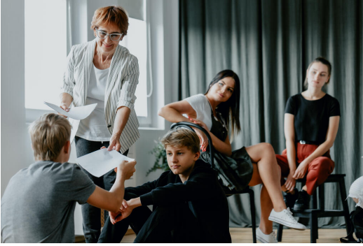
Auch Persönlichkeitsentwicklung steht am Gymnasium im Fokus

Teamfähigkeit und angemessenen Umgangsformen bilden die Voraussetzungen für die Entwicklung einer selbstbestimmten, verantwortungsvollen Persönlichkeit.