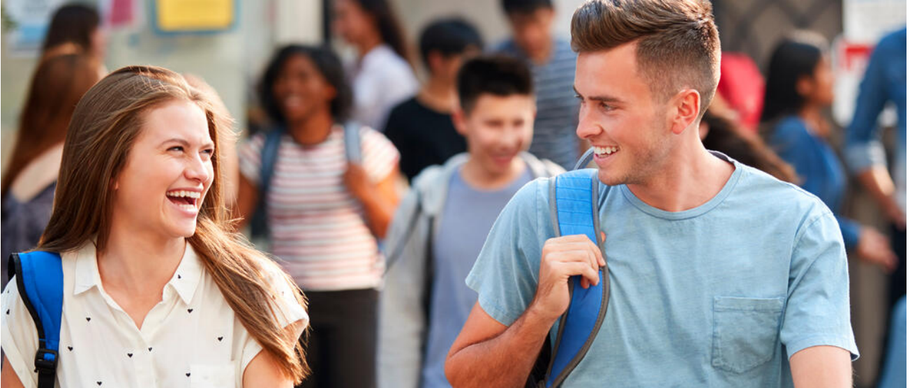
Das Humanistische Gymnasium stellt sprachliche Bildung, klassische Antike und europäische Kultur in den Fokus