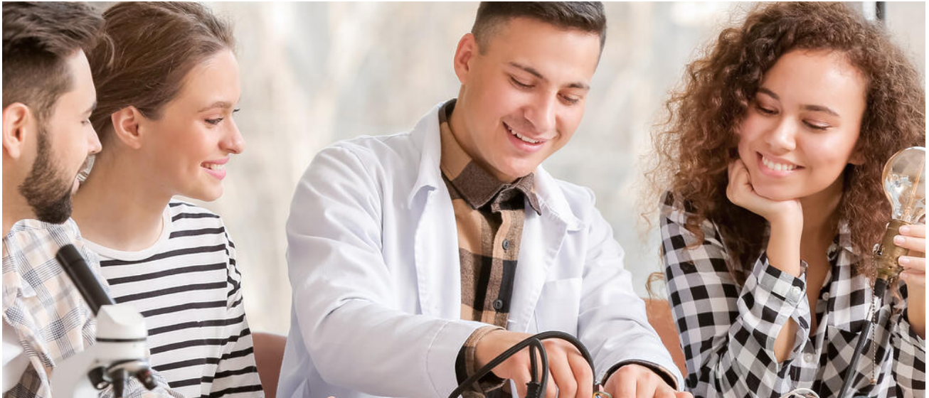
Das Naturwissenschaftlich-technologische Gymnasium setzt einen Schwerpunkt auf den MINT-Bereich