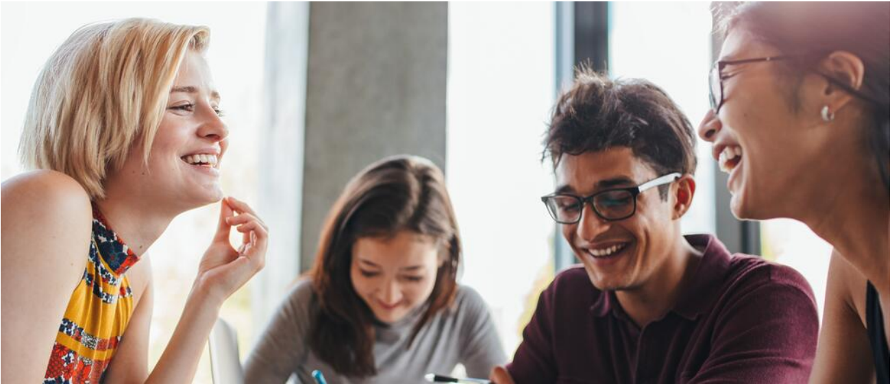
Am Sprachlichen Gymnasium liegt ein Schwerpunkt auf sprachlicher und interkultureller Bildung