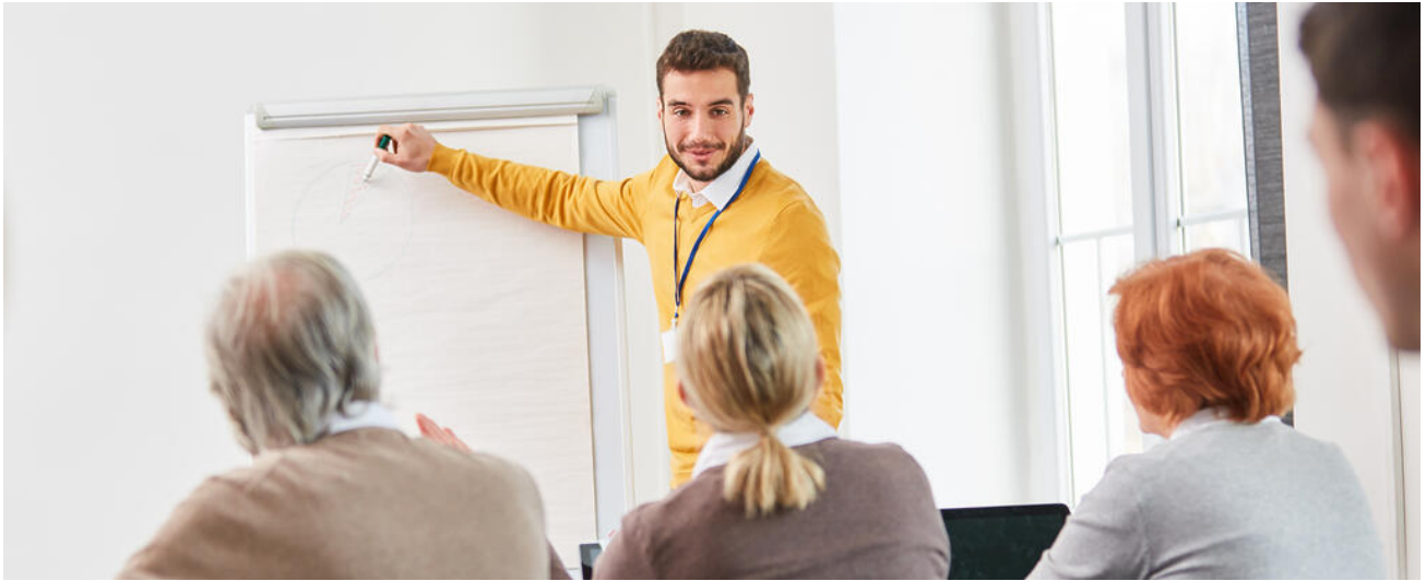
Fortbildungsangebote zum Einsatz mobiler Endgeräte

Neben der Verfügbarkeit einer performanten IT-Infrastruktur hängt der Erfolg des Einsatzes mobiler Endgeräte in Schülerhand maßgeblich von der Kompetenz der Lehrkräfte ab. Ein flächendeckendes Ausrollen eines 1:1-Ausstattungskonzepts soll daher von gezielten Fortbildungen flankiert werden. Ziel ist der Erwerb medienbezogener Lehrkompetenzen, um mobile Endgeräte im konkreten Unterrichtsfach erfolgreich einzusetzen.