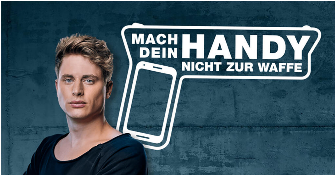
Kampagne mit Falco Punch – Mach dein Handy nicht zur Waffe

Das Bayerische Staatsministerium der Justiz hat gemeinsam mit dem Bayerischen Staatsministerium für Unterricht und Kultus und fünf bayerischen Lehrerverbänden eine Arbeitsgruppe ins Leben gerufen. Diese beschäftigt sich mit Aufklärung über die strafrechtlichen Folgen von illegalen Inhalten auf Schülerhandys sowie der Sensibilisierung für das Thema und Prävention durch Medienbildung.