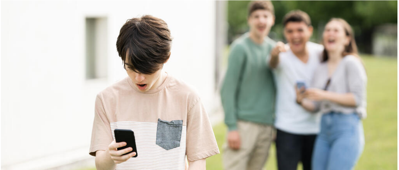
Mobbingprävention - Mit Mut gegen Mobbing!

Soziale Netzwerke, Messaging-Dienste und Videoplattformen gehören heute selbstverständlich zur Lebenswelt der Kinder und Jugendlichen. Daher ist es die Aufgabe der Schule, sie in enger Kooperation mit den Elternhäusern zu einem souveränen, selbstbestimmten und reflektierten Umgang mit digitalen Angeboten zu befähigen. Das Thema Cybermobbing ist hierbei von herausgehobener Bedeutung. Cybermobbing, Netiquette, Schutz persönlicher Daten etc. sind wichtige Lerninhalte an allen Schularten.