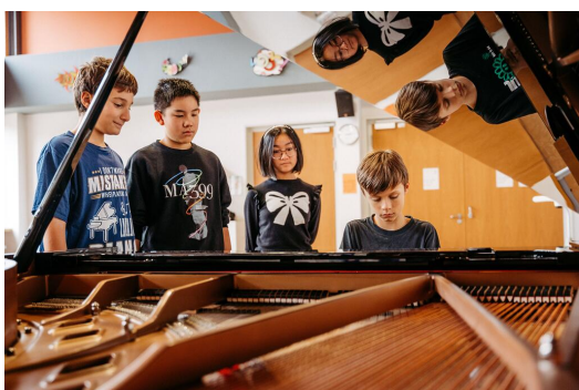
Teilnehmer bei der Musikwerkstatt 2024