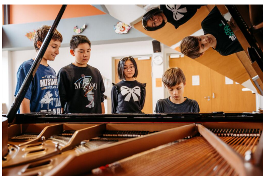
Teilnehmer bei der Musikwerkstatt 2024