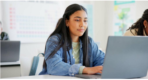
Die kostenlose Bereitstellung von Leihgeräten für Schülerinnen und Schüler leistet einen wichtigen Beitrag zur Bildungsgerechtigkeit

Die Corona-bedingten Unterrichtseinschränkungen und die digitalen Formate im Distanz- oder Wechselunterricht haben den Bedarf an digitalen Leihgeräten für Schülerinnen und Schüler sprunghaft steigen lassen. Unter dem Dach des DigitalPakts Schule wurde daher rasch ein zusätzliches