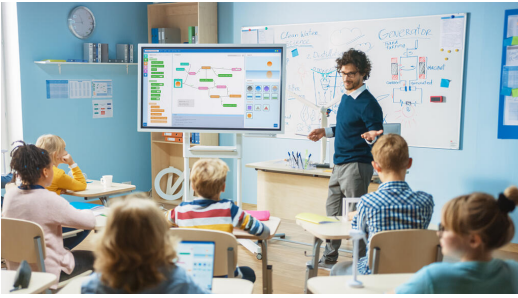
Digitale Klassenzimmer ermöglichen den gewinnbringenden und zeitgemäßen Einsatz elektronischer Medien und Werkzeuge im Unterricht

Bayern ist in der komfortablen Situation, im Gegensatz zu anderen Ländern bereits sehr früh in die Digitalisierung investiert zu haben. In den Förderprogrammen im Rahmen des → Masterplans BAYERN DIGITAL II