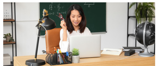
Die Ausstattung von Lehrkräften mit Dienstgeräten ermöglicht ein effektives und rechtssicheres Lehren und Lernen

Dies legt den Grundstein für das im Koalitionsvertrag festgelegte Ziel von 50.000 digitalen Klassenzimmer