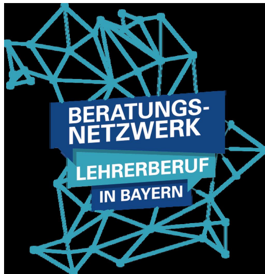
Logo des Beratungsnetzwerks „Lehrerberuf in Bayern“

Sie interessieren sich für den Lehrerberuf, haben aber noch Fragen? Das „Beratungsnetzwerk Lehrerberuf in Bayern“ steht Ihnen ab sofort zur Verfügung, um Sie rund um Ihren individuellen Weg in die Tätigkeit als Lehrer/-in zu beraten.