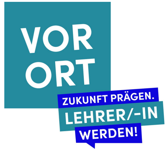
Das Logo von „VOR ORT Zukunft prägen. Lehrer/-in werden!“

Im Schuljahr 2023/2024 hat das Bayerische Staatsministerium für Unterricht und Kultus ein bundesweit einzigartiges Projekt zur Gewinnung junger, talentierter Lehrkräfte ins Leben gerufen, das die bereits bestehende Kampagne „Zukunft prägen. Lehrer/-in werden!“ ergänzt: Lehrkräfte informieren „vor Ort“, d.h. an der Schule selbst, interessierte Schülerinnen und Schüler über den Beruf der Lehrkraft.