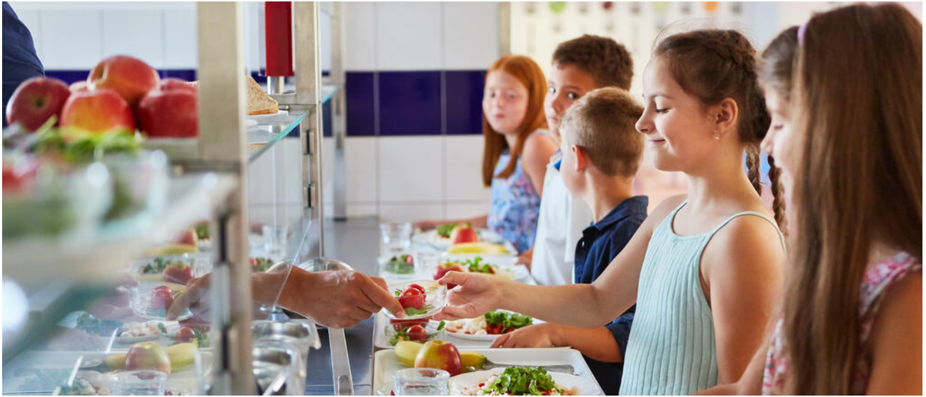
Gesunde Ernährung in der Schule