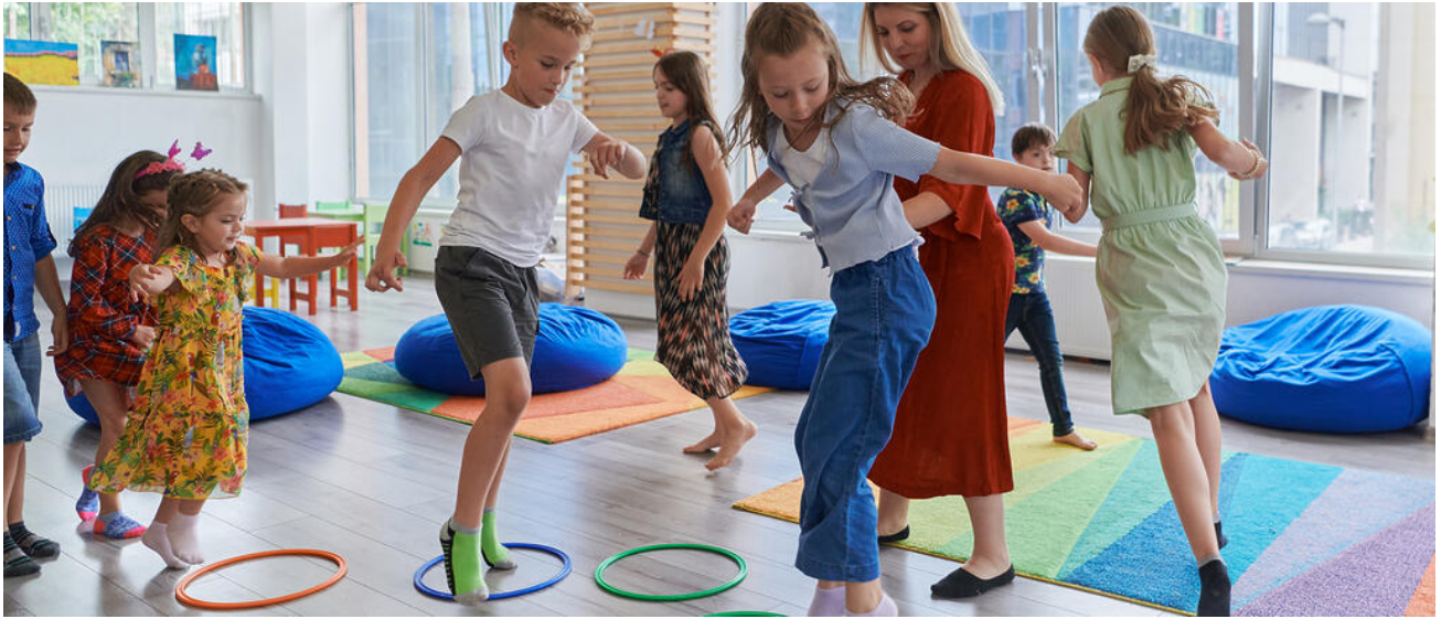
Bewegung außerhalb der Turnhalle: Auch im Klassenzimmer kann man körperlich aktiv sein

Mehr Sport und Bewegung in der Schule! Körperliche Aktivität ist nicht nur etwas für den Sportunterricht und außerunterrichtlichen Schulsport, sondern jedes Fach bietet Möglichkeiten für Bewegung. Diese Seite gibt einen Überblick über Konzepte und Initiativen zur Bewegungsförderung.